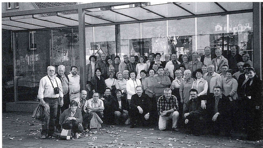
Dreitagesausflug nach Trier/Mosel, Speyer und Heidelberg