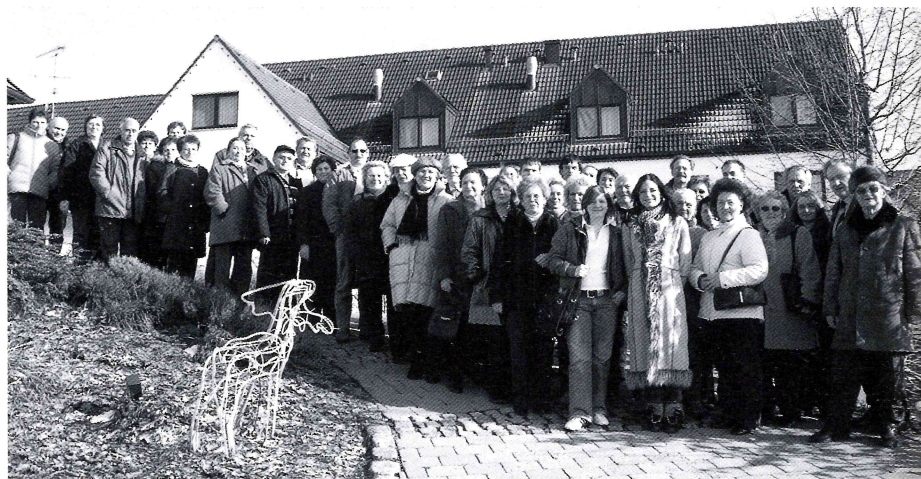
Tagesausflug nach Ulm und Umgebung