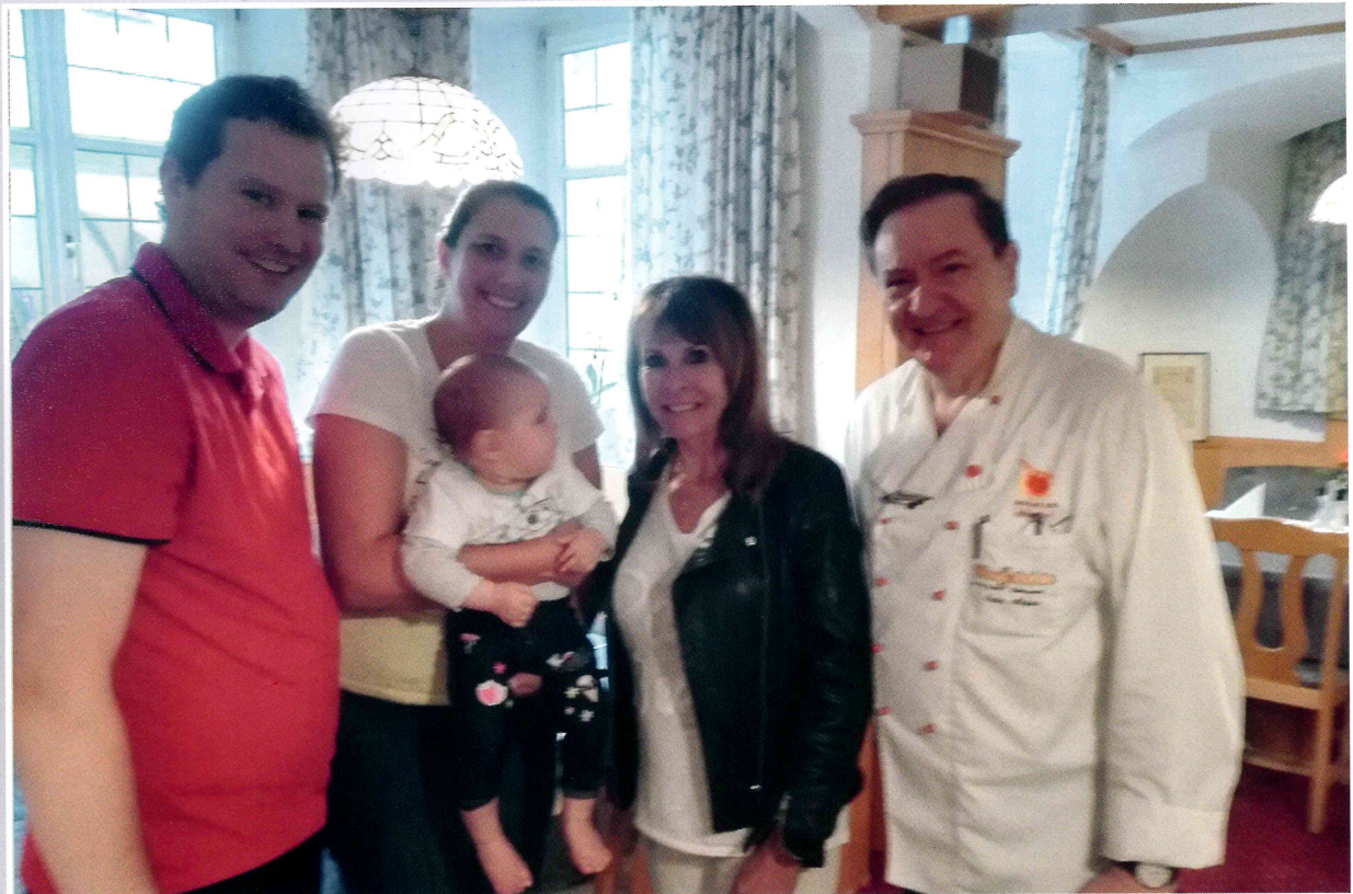
Besuch aus dem Showbusiness im Hotel Meerfräulein: Schlagerstar Ireen Sheer