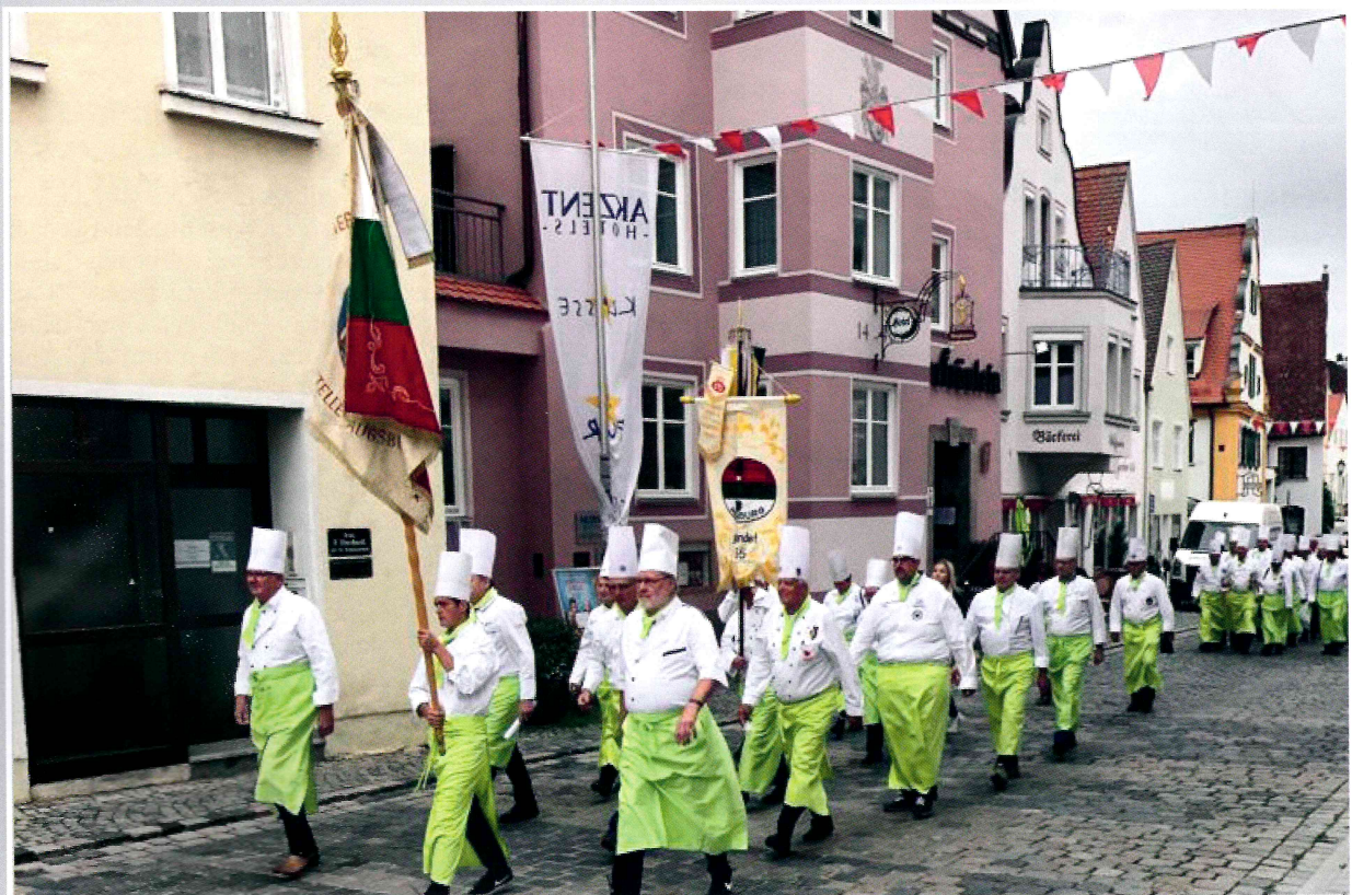
Mitglieder des Clubs der Köche Donau-Ries und befreundeter Kochclubs auf dem Weg zur Laurentiusmesse in St. Emmeram